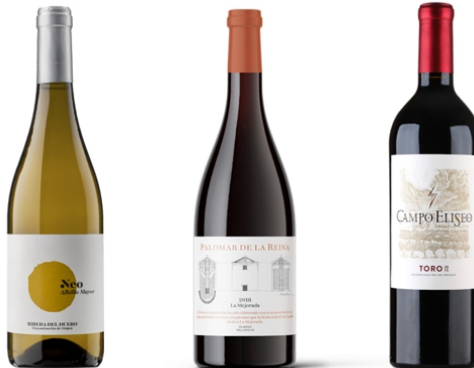
Neo Albillo Mayor 2019, Palomar de la Reina 2018, Campo Elíseo 2015.