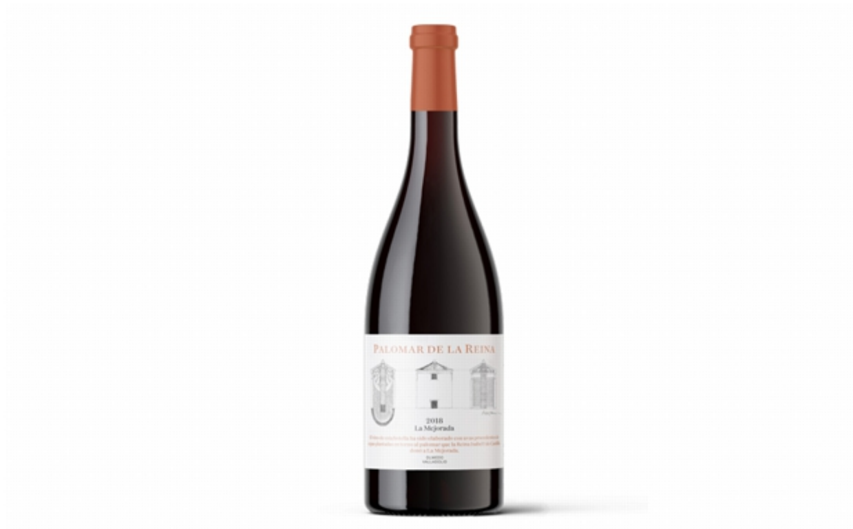
Palomar de la Reina 2018.

Vino de la Tierra de Castilla y León. Olmedo (Valladolid). Precio recomendado: 47,50 euros.