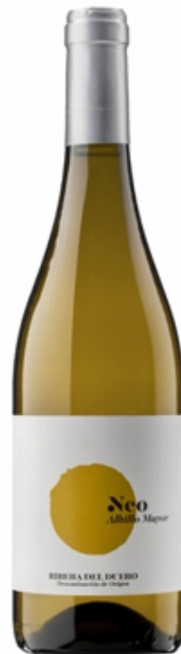
Neo Albillo Mayor 2019.

DO Ribera del Duero. Castrillo de la Vega (Burgos). Precio recomendado: 5,95 euros.